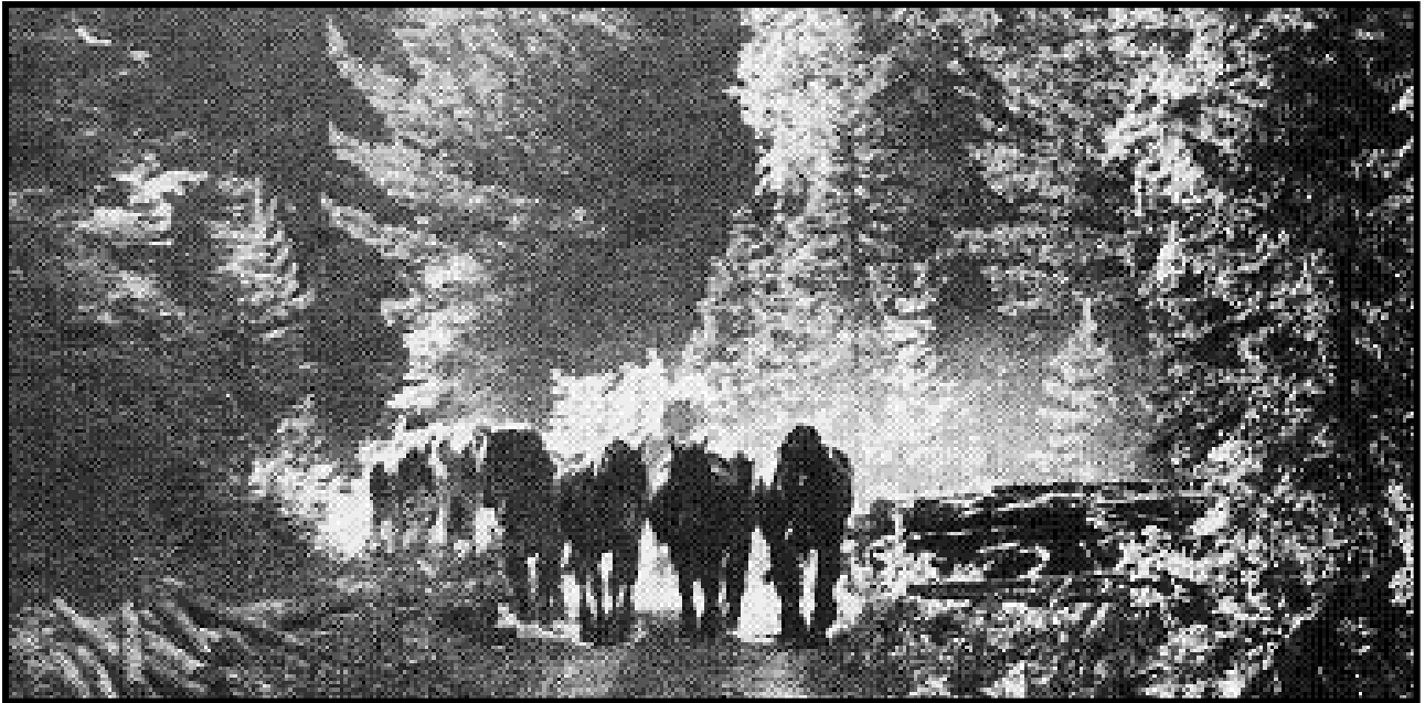
Hästar på skogsbete

D u kan väl berätta mer om hästar på skogen i Fäbodtrumpeten, sade häromsistens en läsare som hört mig tala om alla de hästar man kunde möta i 10-milaskogen mellan Stöllet och Malung på 1950-talet. Det var Uddeholms bolags skogshästar som då var på sommarbete. Det var ett äventyr att se, höra och känna dessa stora, starka djur dundra fram genom skogen.